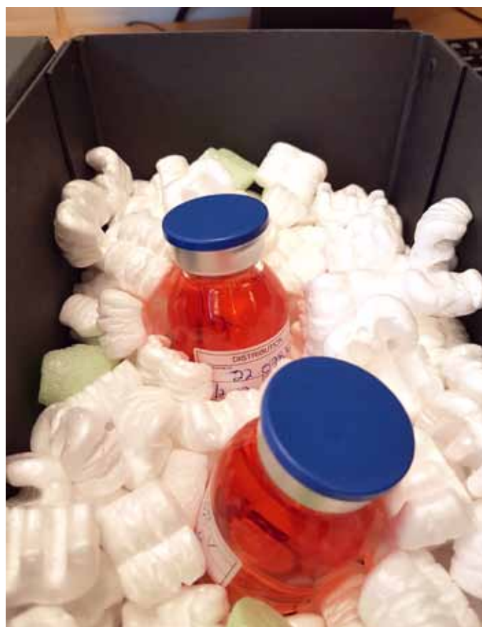
Figur 1 To hornhinder i lukkede glasflasker pakket og klar til afsendelse til kirurgen

teknikken muliggjorde, at donor-hornhindens ventede på patienten snarere end omvendt, ville det være perspektivrigt, hvis donor-hornhinder kunne nedfryses og opbevares i mange måneder, måske i mange år. Steffen Sperling og Niels Ehlers udforskede derfor kryo-præserving af hornhinder, og kryo-præservede hornhinder blev anvendt til patientbehandling, efter at vitaliteten af hornhinderne blev bekræftet efter optøning. I 2009 publiceredes en klinisk opfølgning af patienter transplanteret i 1978-79 med en kryo-præservede hornhinde, der viste, at 25% fortsat havde en klar og fungerende hornhinde (4) Teknikken blev dog opgivet i 1980, da en stor del af de nedfrosne hornhinder blev beskadiget under optøningen og derfor måtte kasseres.