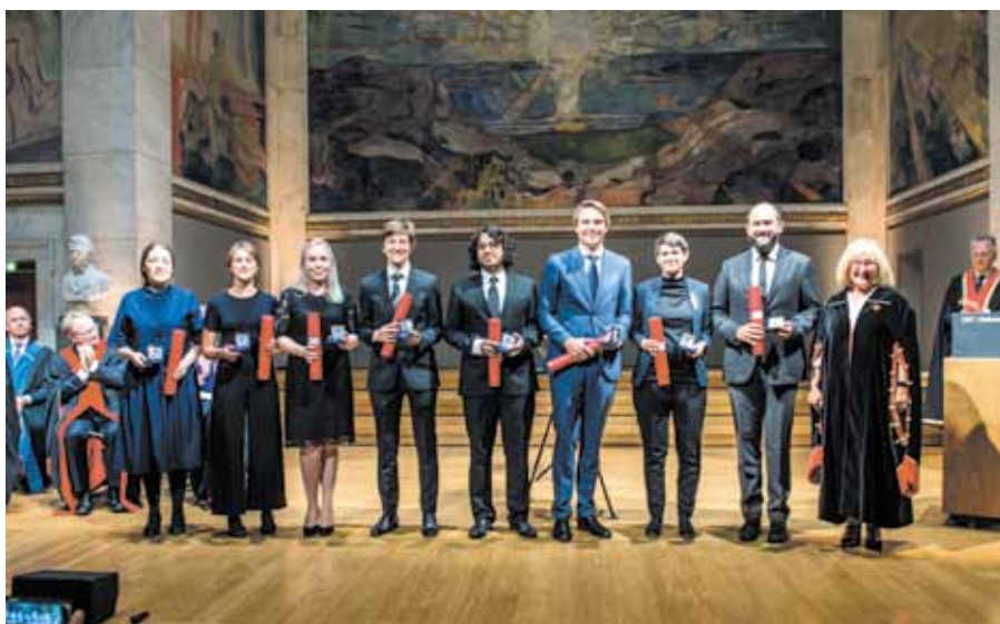
Prisutdeling - årets mottakere av Kongens gull for beste avhandling ved Universitet i Oslo. Fotograf: Morten Kanne-Hansen (UiO)

endotelcelletetthet, refraksjon, astigmatisme, intraokulært trykk og glaukom. Resultatene viste at begge de to operasjonsmetodene i studien er gode behandlingsalternativer for pasienter med sen dislokasjon av IOL-kapsel-komplekset. Operasjonsmetodene ga et tilnærmet likt postoperativt visus og begge ble ansett som trygge. For enkelte kliniske parametere, inkludert postoperativ refraksjon, var det derimot forskjeller som potensielt kan