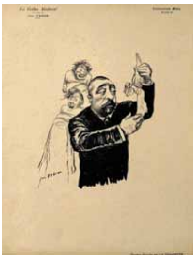
Satirisk tegning af Georges Gilles de la Tourette i anledning af retssagen 'Gouffés kuffert'.

Under alle omstændigheder: Lige-gyldigt om Mozart havde Tourette's eller ej, er det godt at høre hans