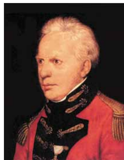
Constanze Mozarts 2. mand, den danske diplomat Georg Nicolaus von Nissen 1809. Netop udnævnt til etatsråd. Malet af Ferdinand Jagemann, som var Goethes foretrukne maler. Salzburger Museum Carolino Augusteum.