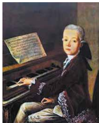
Mozart som teenager ved klaveret.

Derimod havde han et ovenud eksalteret liv. Han skrev 600 værker,