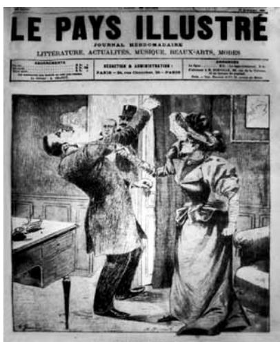
Samtidig tegning af mordforsøget på Tourette. En tidligere patient skyder Tourette i hans hjem og hævder, at hypnose har ændret hende.

musik, som også professionelle musikere elsker at spille.