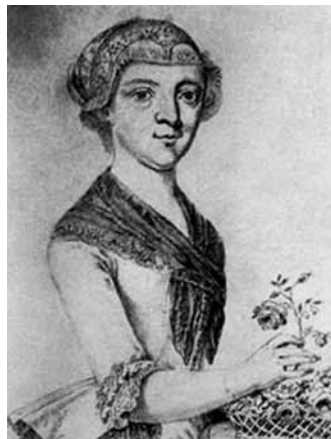
Bäsle, Mozarts kusine, hvis breve fra Mozart er en hovedkilde til Mozarts biografi.