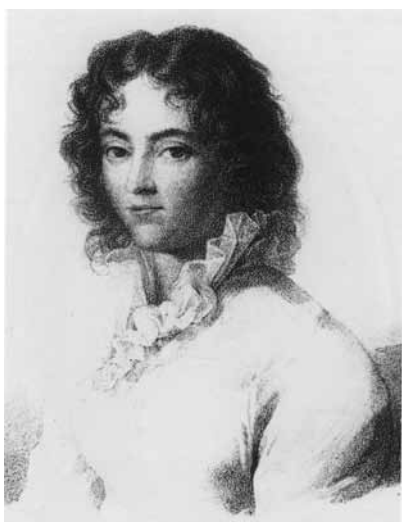
Constanze Mozart som 20 år i 1782. Litografi efter maleri af Joseph Lange. Internationale Stiftung Mozarteum Salzburg.

Kusinen og Mozart skrev frit til hinanden: Mozart skriver om en koncert med snobbet publikum: 'Der var en del noblesse til stede, hertuginde Bredrøv, grevinde Brunstsyg