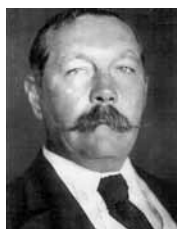
Sir Arthur Conan Doyle.