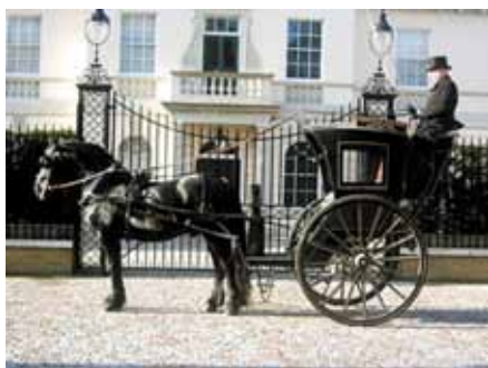
221b Baker Street. Hansom cab i forgrunden.

Han blev såret i det ene ben eller en arm (forskellige angivelser) af en Jezail bullet. Jezail er en musket. I The Sign of Four møder han sin tilkommende kone Mary Monston, mens Sherlock forbliver ungkarl.