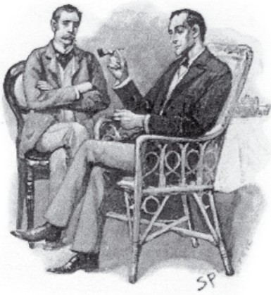
Sherlock Holmes og dr. Watson tegnet af Sidney Paget.

har mistanke til min mitralklap, vil jeg værdsætte Deres mening om mitralen”.