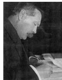
Sir Arthur ved skrivebordet.

Foruden Bell var Sir Robert Christison (1797-1882), en af grundlæggerne af den moderne nefrologi, en inspiration for Doyle. Sir Robert og flere andre på Edinburgh Universitet undersøgte Calabar bønner (fra