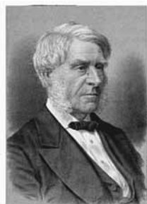
Sir Robert Christison (1797-1882). En af grundlæggerne af moderne nefrologi.