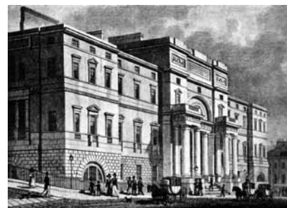
Edinburgh University. Østfacaden af the Old College. I 1887 blev der sat et tårn på.