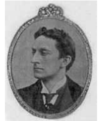
Sherlock Holmes som portrætteret i The Sherlock Holmes Museum .

Novellerne er grupperet i Adventures of Sherlock Holmes (1891), Memoirs of Sherlock Holmes (1892), The Return of Sherlock Holmes (1903), His Last Bow (1917) og The Case-Book of Sherlock Holmes (1927).