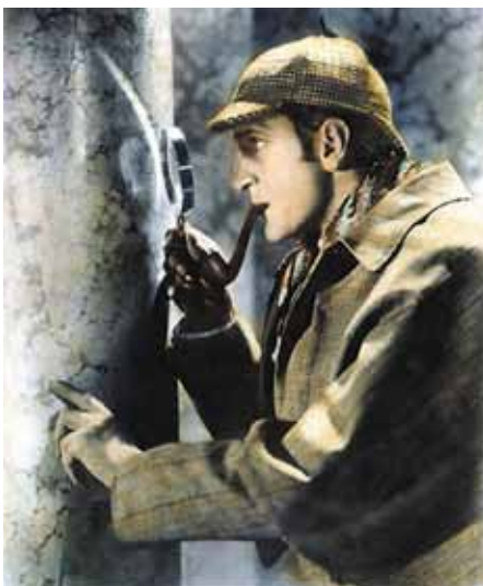
Sir Basil Rathbone, den mest populære fremstiller af Sherlock Holmes.

I The Story of The Bald-Headed Man spørger Mr. Thaddeus Sholto Watson, om han har medbragt sit stetoskop. "Da jeg