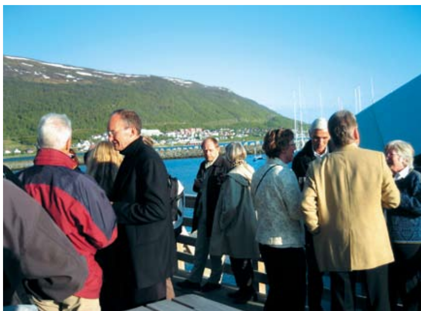
Åhningsreception på POLARIA museet.