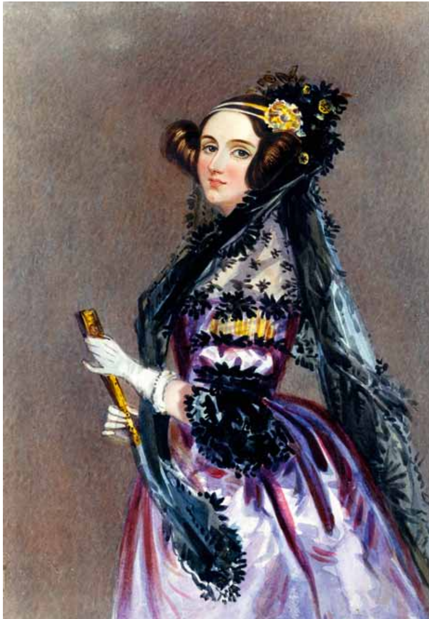
Ada Lovelace: en pioner

https://commons.wikimedia.org/wiki/File:Ada_Lovelace_portrait.jpg