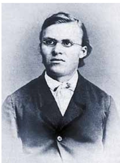
Unge Nietzsche vid studentexamen i Schulpforta 1864.