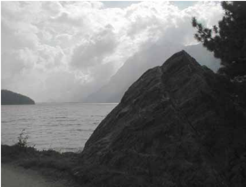
Klippan vid Sils Maria där Nietzsche fick sin berömda vision om den eviga återkomstens idé.