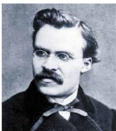
Nietzsche som nyutnämnd professor i klassisk filologi 1869.

att de märkliga synerna kan vara ett första tecken på begynnande sinnessjukdom – "min far dog nämligen av en hjärnsjukdom"!