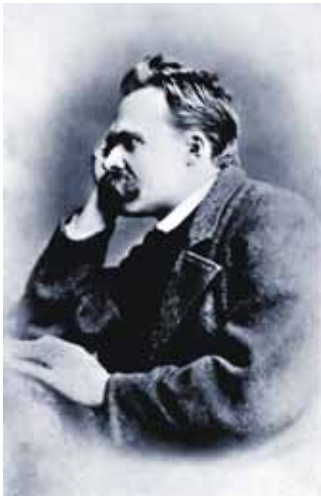
Nietzsche vid tiden för publiceringen av Den glada vetenskapen 1882.