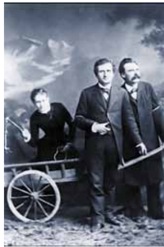
Vännerna Lou Salomé, Paul Ree och Nietzsche 1882. Den synskadade Nietzsche bär inte längre några glasögon.

mogne 14-åringen bildningsromaner om sitt eget liv på temat hur jag blev den jag är och han förbereder sig för intagning vid elitinternatskolan i Schulpforta. Efter studentexamen påbörjar Nietzsche sina studier i teologi, men ganska snart är det klassisk filologi som blir hans huvudämne. Den klassiska grekiska filosofin intresserar honom mycket. Nietzsche studerar knappt ett år i Bonn men flyttar därefter över till universitetet i Leipzig, mycket på grund av en viss professor Ritschl som är verksam där och som Nietzsche har höga tankar om. Denna uppskattning är ömsesidig och redan 1869 blir Nietzsche på Ritschls inrådan utnämnd till professor i klassisk filologi vid universitetet i Basel. Den 24-årige Nietzsche erhåller professuren utan att ens ha hunnit disputerat eller förvärva någon docentkompetens. Doktorsavhandlingen färdigställs emellertid senare samma år. Professorsuppdraget - som i första hand innebär undervisning - är inte betungande och Nietzsche lägger sina mentala krafter på att