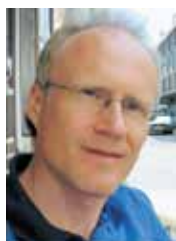
Av Joakim Färdow, Växjö

Led filosofen av Charles Bonnetts syndrom?