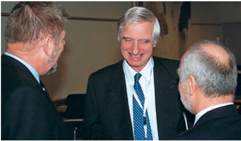
Deltagare i DOS efterutbildningskursus 2007.