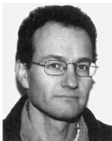
Af Klaus Trier