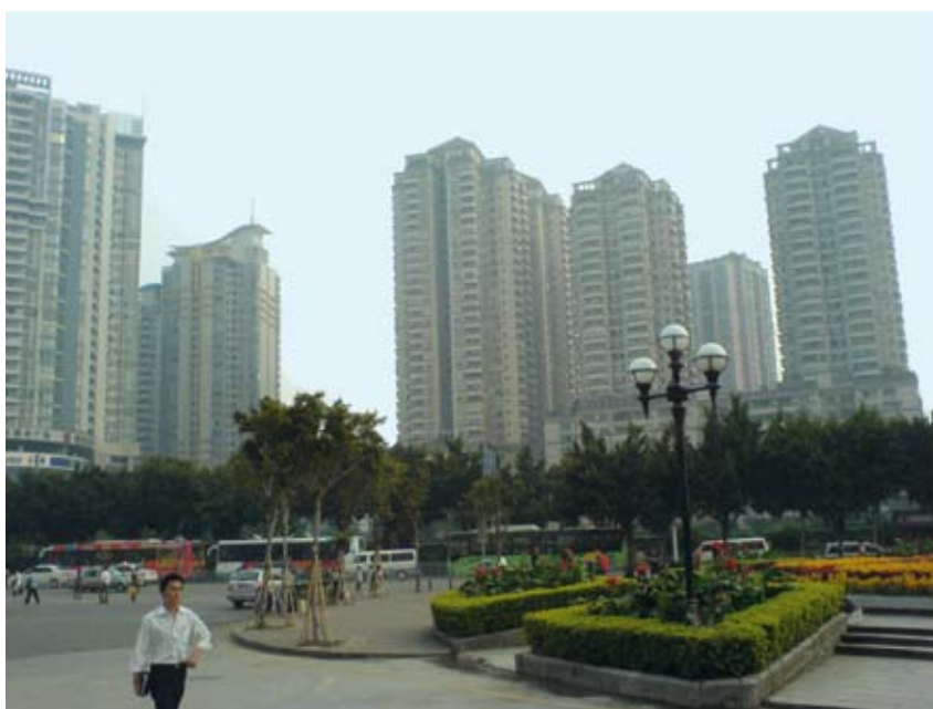
Sådan bor man i det moderne Kina

Fra starten var ledelsen af kommunistpartiet splittet mellem Mao Ze-dong, som lagde vægt på ideologi, og en fløj af pragmatiske økonomer, som anså det for den vigtigste opgave at sikre den kinesiske befolkning mad på bordet. Da Mao i 1966 følte sig udmanøvreret, appellerede han direkte til masserne med opfordringen om at "beskyde hovedkvarteret", og udløste dermed kulturrevolutionen. Selvom rødgardisternes vilkårlige regimenter med terror, angiveri og mord, især rettet mod intellektuelle, ikke helt nåede samme højder som i Campuchea under Pol Pot, blev denne periode en stor prøvelse for det kinesiske folk. Deng Xiao-ping,