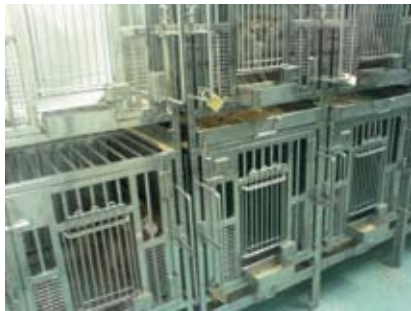
Top-moderne faciliteter til dyreeksperimentelle studier (her ses aber)

laboratoriet finder man confocal laser scanning mikroskop, HPLC-MS, flowcytometer, udstyr til protein og nucleinsyre analyse etc., mens den kliniske afdeling er udstyret med bla. ultralyd biomikroskopi og bageste og forreste afsnits OCT.