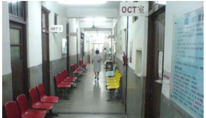
Centeret er udstyret med det nyeste udstyr til kliniske undersøgelser

I 2008, samme år som de olympiske lege bliver afholdt i Beijing, vil landet være vært for den XXXI oftalmologiske verdenskongres i Hong Kong.